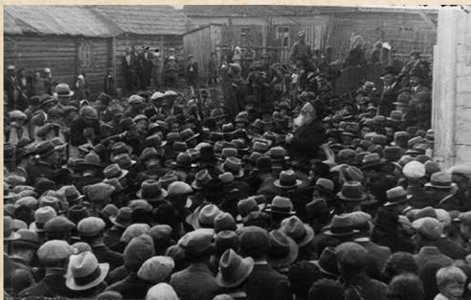
הלווייתו של רבי ירוחם. הגאון רבי אלעזר ספקן משגיח ישיבת ראדין מספיד (מתוך הספר המשגיח רבינו ירוחם)

לפני כשלושה שבועות חלה רבי ירוחם במחלת מעיים קשה ('א שווערע מאגנן-קראנקייט'). המחלה עשתה רושם עז בעולם הישיבות. טובי הרופאים הובאו, אך כל המאמצים לא הועילו, וביום שני בשעה 2 בצהריים הוא השיב את נשמתו הטהורה. תנצב"ה.