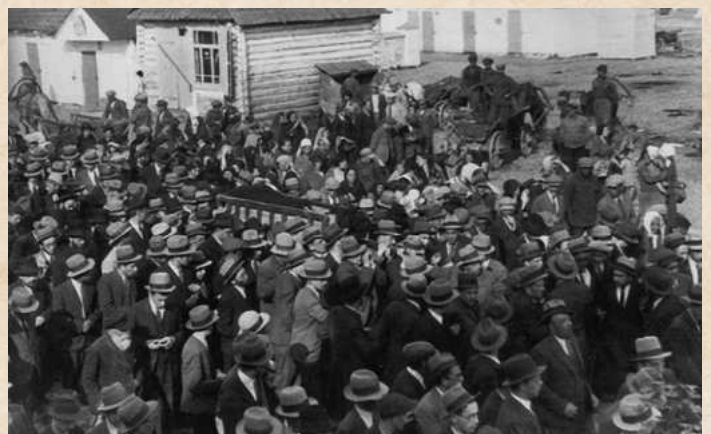
מסע ההלוויה ברחובות עירת מיר (מתוך הספר המשגיח רבינו ירוחם)