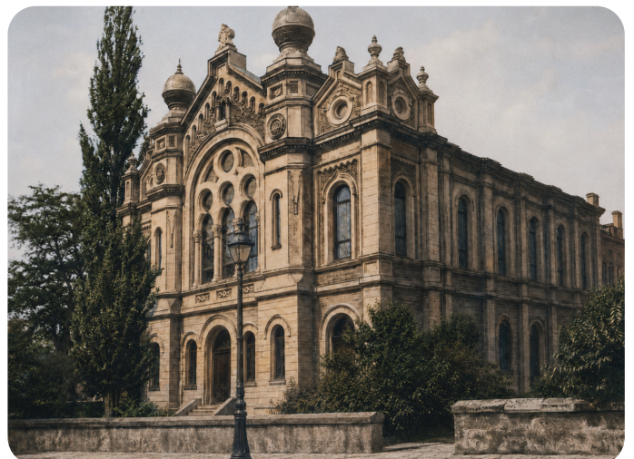
חזית בית הכנסת הגדול בגרוסורדיין

כה בזכות "שטיקל תורה" מבריסק, ובזכות רבו הגדול שהשריש בו את דרך הלימוד, הופרו חוקי הטבע, וניצלו חיייו של מי שלימים יאיר את עולם התורה - "תורת חיים" כפשוטו.