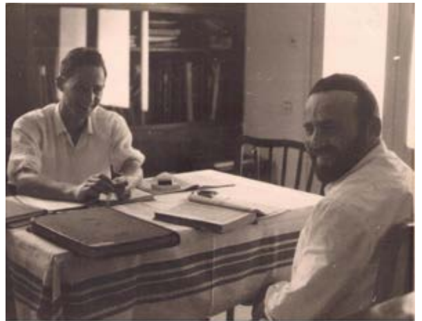
רבי נחום בצעירותו בלימוד עם רבי חיים עוזר אלפא