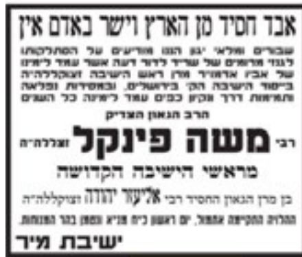
מודעות אבל שהתפרסמו בעיתונות לפני עשרים שנה - מתוך הארכיון היהודי

גדול זה, ובשנים אלו כמעט ולא נתן שינה לעיניו וטרח במס"ג עצומה. עם בניית הישיבה עבר לגור בדירתו הסמוכה לישיבה.