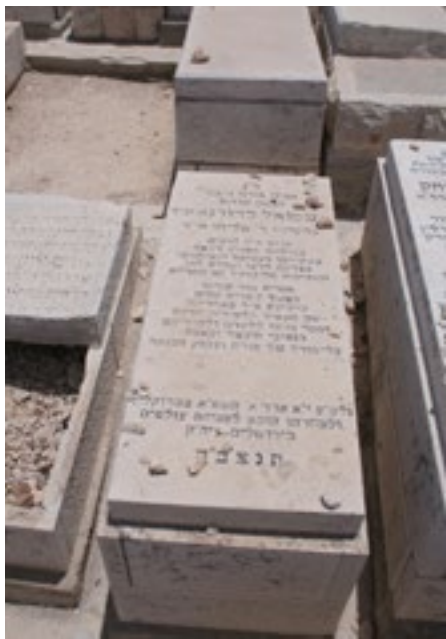
ההתחזקות בלימוד בתקופה ההיא, היתה נעוצה בהרגשה שזהו סוף העולם והם בהשגחה פרטית <

היה מקובל כחשוב גם בקרב העלטרערס בישיבה.