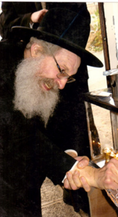
מרנן ורבי ר' נתן צבי פינקל זצוק"ל