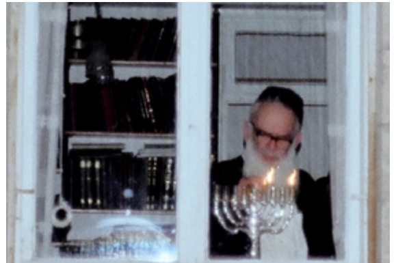
מרנן ורבי ר' חיים שמואלביץ זצוק"ל