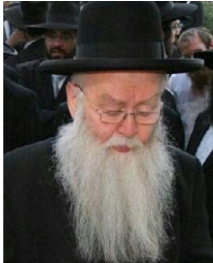
ושבו, ולאחר מכן הפטיר בענוותנותו - באמת אינני יודע מה הפשט בגמרא הזאת.